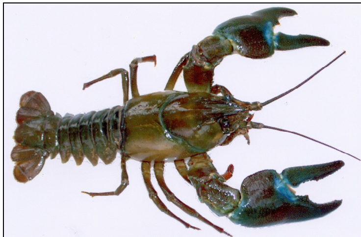
Ecrevisse de Californie ou signal ( Pacifastacus leniusculus )

Adresse : Parc naturel régional du Morvan – Maison du Parc 58 230 SAINT-BRISSON - FRANCE Tel +33 (0)3 86 78 79 00 - Fax +33 (0)3 86 78 74 22 – email : pierre.durlet@parcdumorvan.org